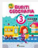
Geografia, 3 Projeto Buriti (Reformulado) Autor: Obra coletiva Editora Moderna