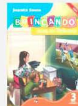
Brincando com as Palavras, 3 Autor: Joanita Souza Editora do Brasil