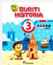
História, 3 Projeto Buriti (Reformulado) Autor: Obra coletiva Editora Moderna