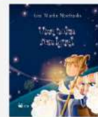
Uma noite sem igual Autora: Ana Maria Machado Editora: FTD