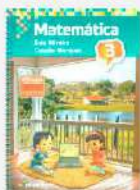
Matemática, 3 Autora: Ênio Silveira e Cláudio Marques Editora Moderna