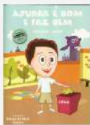
Ajudar é bom e faz bem Autor: Almeida Júnior