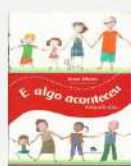
E algo aconteceu naquele dia... Autor: Jonas Ribeiro Editora: do Brasil