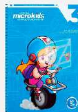
Informática, Microkids, vol 3 Autores: Lisalba Camargo e Roselita C. Guimarães Editora: Camargo