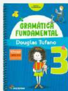
Gramática, 3 Reformulada Autora: Douglas Tufano Editora Moderna