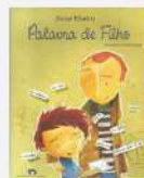
Palavra de filho Autor: Jonas Ribeiro Editora: do Brasil