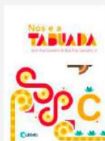
Nós e a Tabuada, C Autor: Giovanni e Giovanni Jr. Editora Quinteto