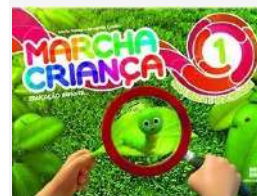
Marcha Criança 1 Sociedade e Natureza Educação Infantil Autores: Maria Tereza e Armando Coelho Editora Scipione