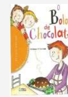
Bolo de Chocolate Autora: Pilar Ramos e Maria Rosa Aragó Editora do Brasil