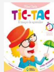
Tic Tac É tempo de aprender, 1 Autora: Vilza Carla Editora do Brasil