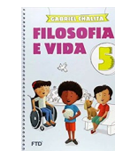
Filosofia e Vida, 5 Autor: Gabriel Chalita Editora: FTD