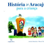
História de Aracaju Autor: Antônio Wanderley e Marcos Vinícius Editora: Sergipe Cultura