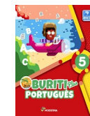
Português, 5 Buriti Plus Editora: Moderna