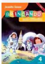
Brincando com Ciências 4º ano Autor: Joanita Souza Editora do Brasil