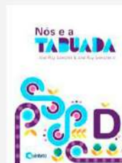
Nós e a Tabuada D Edição Reformulada Autor: Giovanni e Giovanni Jr Editora FTD