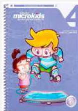
Informática, Microkids, vol 4 Autores: Lisalba Camargo e Roselita C. Guimarães Editroa: Camargo