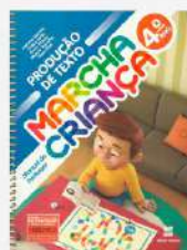
Produção de Texto, 4º ano Marcha Criança Autor: Antônio Barreto a Nara Bitai Editora Scipione