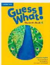
Inglês: Guess What!, 4 Autor: Lucy Frino Editora Cambridge