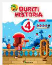
História, 4, Projeto Buriti (Reformulado) Autor: Obra coletiva Editora Moderna