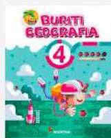
Geografia, 4 Projeto Buriti (Reformulado) Autor: Obra coletiva Editora Moderna