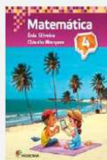
Matemática, 4 Autora: Ênio Silveira e Cláudio Marques Editora Moderna