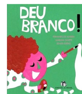
Deu branco! Autores: Fernando de Almeida, Mariana Zanetti e Renata Bueno Editora do Brasil