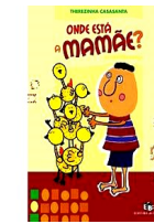
Onde está a mamãe? Autora: Therezinha Casasanta Editora do Brasil